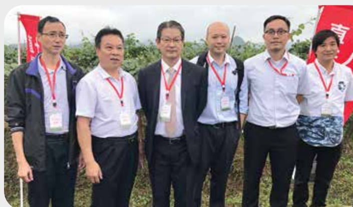
小組及商會代表參觀蔬菜水果種植基地