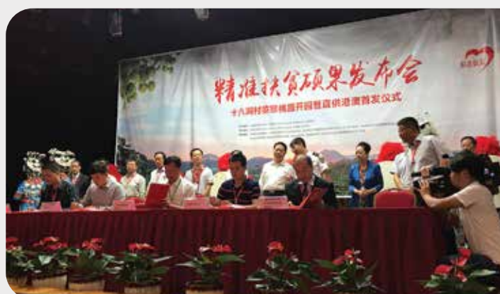
澳門蔬菜批發商會代表簽署銷售合作協議