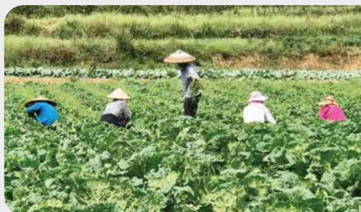
當地農民進行蔬菜收割